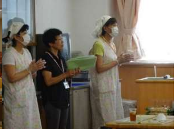
●いつも、がんばっておられるボランティアさん