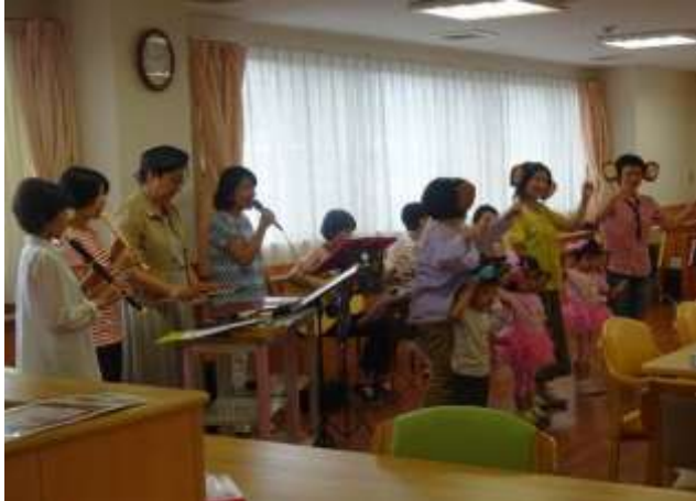
● Love Song クラブの皆さんによる演奏

緩和ケア病棟七夕コンサートが 7月10日（金）午後1：30～2：00入院患者さん・ご家族・ボランティアさん・医師・看護師・総勢35名の参加で行われました。ハートのこもった温かい音色でコンサートが開かれました。いっしょに皆で歌をうたったり、リズムに合わせて手をたたいたり…楽しい時間を過ごしました。